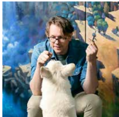
■ Valkoinenpaimenkoira Mörkö pitää taiteilijalle seuraa ja toimii myös tämän mallina työhuoneella Jyväskylän Lutakossa.

”Suhtaudun nöyrästi siihen, että olen saanut vaikutteita Dalin lisäksi esimerkiksi englantilaiselta John Martinilta . Molempien maalauksia olen matkustanut katsomaan ulkomaille. He kuuluvat taiteen tekijöiden suureen kuoroon, johon minäkin haluan antaa oman ääneni.”